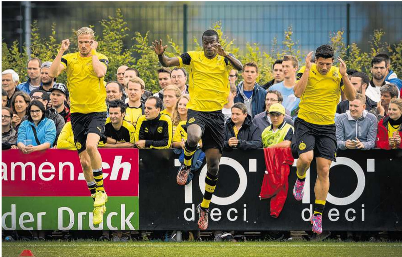
Massenandrang: Die Spieler von Borussia Dortmund locken 2800 Zuschauer ins Stadion Grünfeld.

«Für das Image des Vereins und auch jenes der Stadt war es ein gelungener Anlass», meint Fäh. Der Name Rapperswil-Jona sei von den gut 60 akkreditierten Journalisten weit herumgetragen worden.